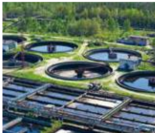
EAU & AIR