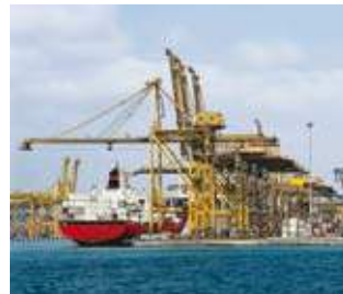
GRUES ET PONTS ROULANTS

Outre à répondre aux exigences d'application du marché, Gefran établit des rapports de partenariat avec ses propres clients pour étudier la meilleure solution apte à optimiser et à accroître les performances des différentes missions.